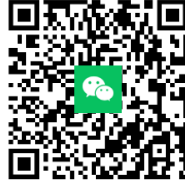
培训部客服二维码